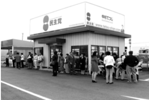
郡山事務所写真 郡山事務所略図

こちらは毎日オープンというわけにはいかないのですが、機会がありましたらご利用頂きますようよろしくお願いいたします。